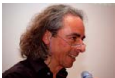
Zum Schluss der Veranstaltung ein exotisches Thema: Digitale Fotografie von Erhard J. Scherpf aus Kassel.